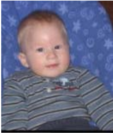
Ilustración tomada de www.pwsausa.org

Sea un modelo del lenguaje para el niño/a, hablele de forma clara y de frente cuando se dirija a él. Recuerde que su hijo está en constante alerta visual, captando e imitando todo lo que usted hace. Debe tener presente que su principal tarea es guiarlo a desarrollar su vocabulario.